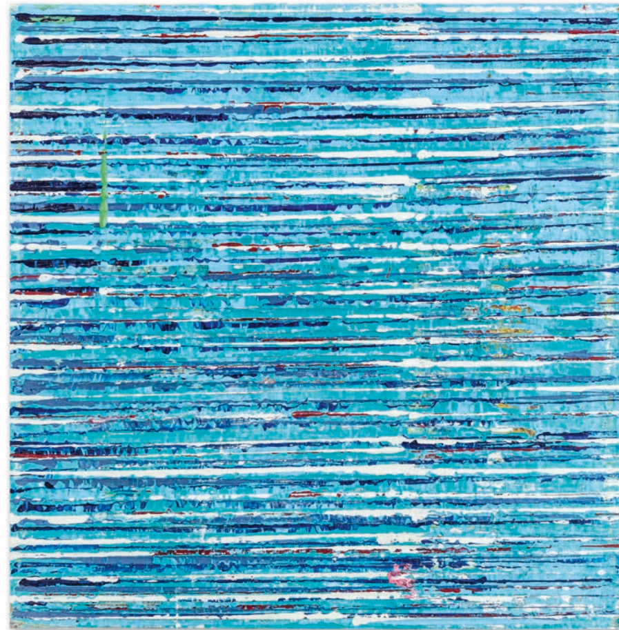
Marius Singer COLOUR STRUCTURES 2026 60 x 60 x 4 cm, Acryl auf Leinwand

Mit freundlicher Unterstützung der DHL Group