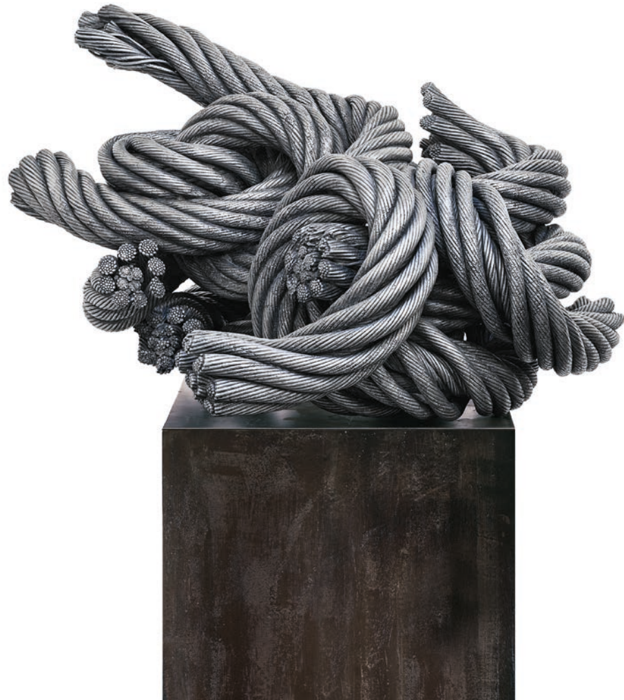
Till Augustin MEDUSA 2024, 66 x 60 x 42 cm ca. 150 kg, Stahlseile, geschmiedet, verschweißt, feuerverzinkt und poliert

Aus einem Text von Dr. Barbara Renftle (Kustodin in der Galerie Stiftung BC – pro arte)