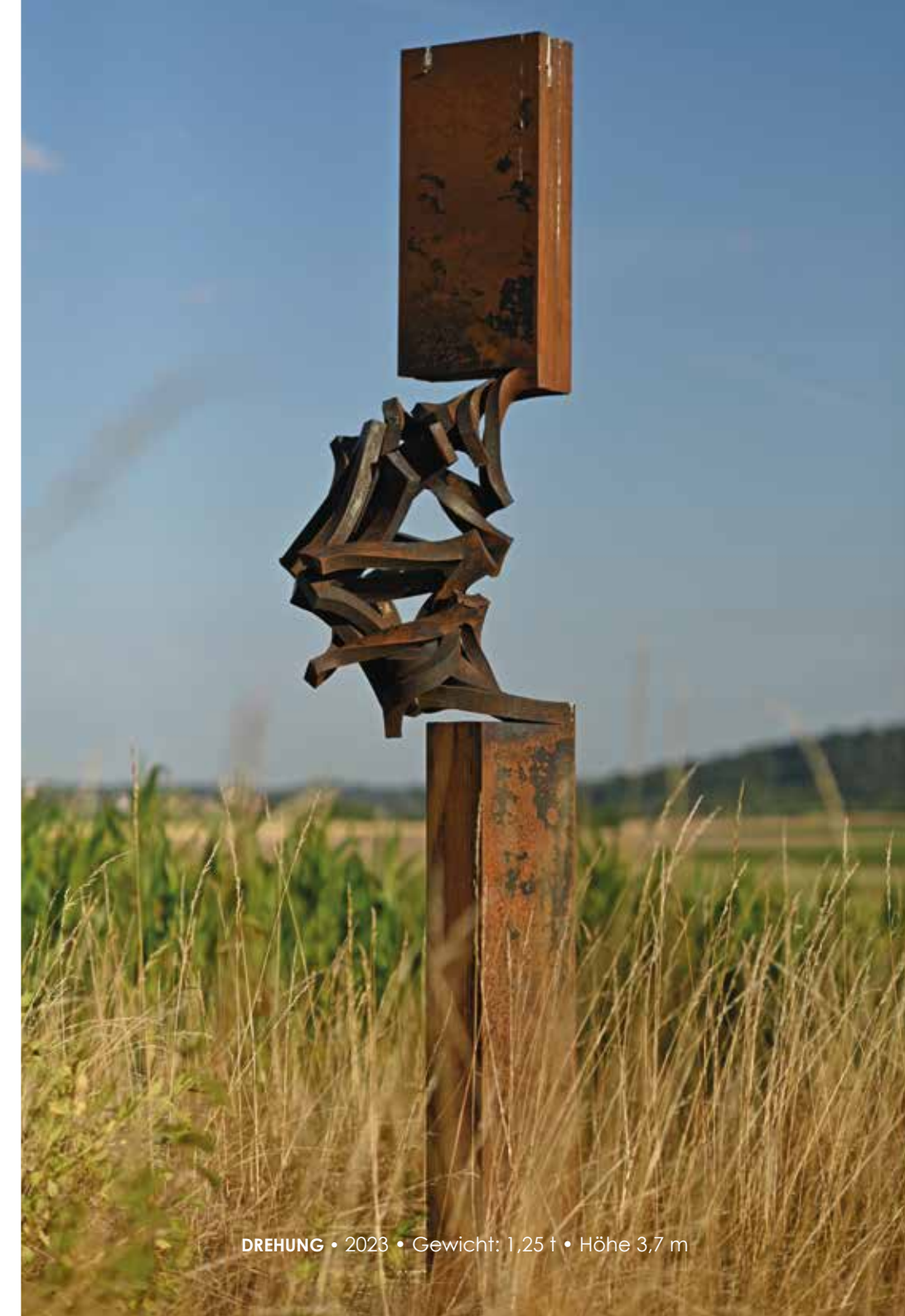
DREHUNG • 2023 • Gewicht: 1,25 t • Höhe 3,7 m