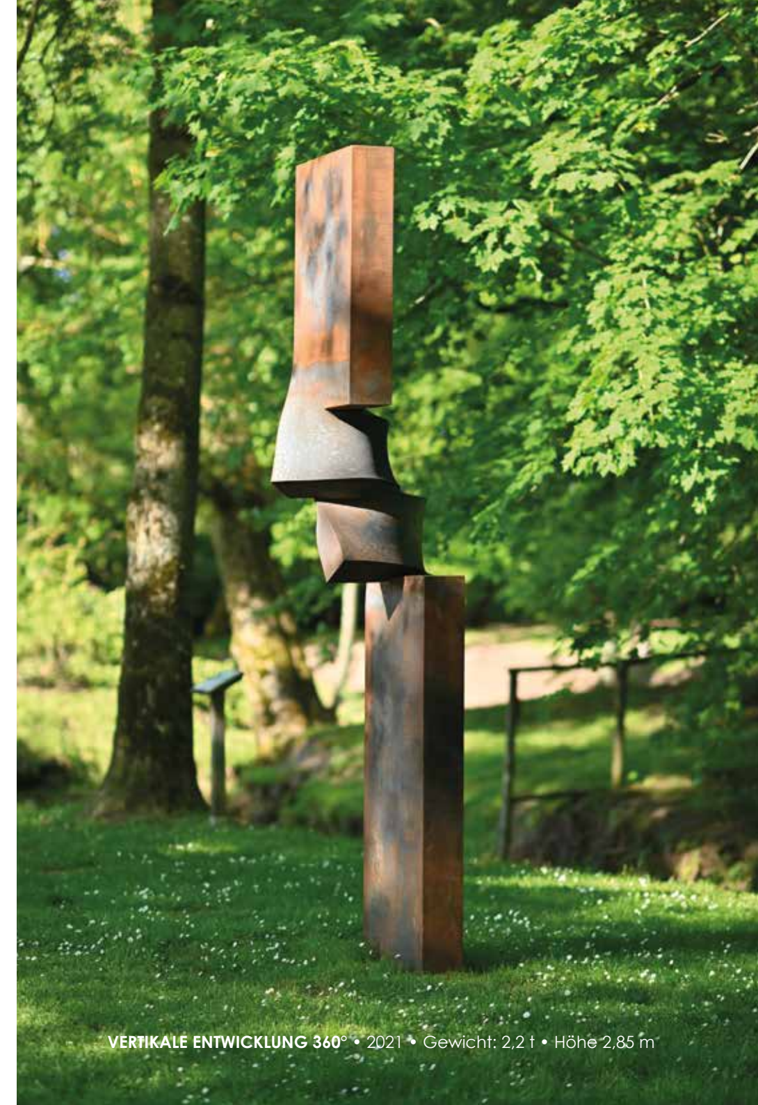
VERTIKALE ENTWICKLUNG 360° • 2021 • Gewicht: 2,2 t • Höhe 2,85 m