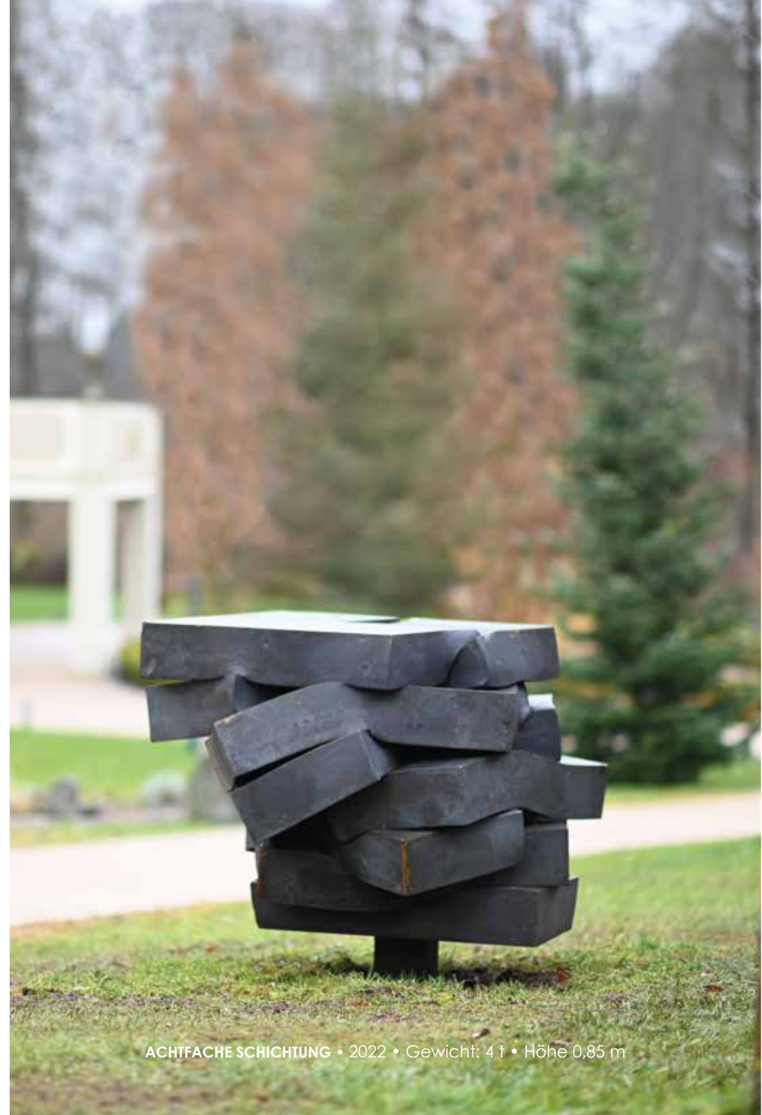
ACHTFACHE SCHICHTUNG • 2022 • Gewicht: 4 t • Höhe 0,85 m