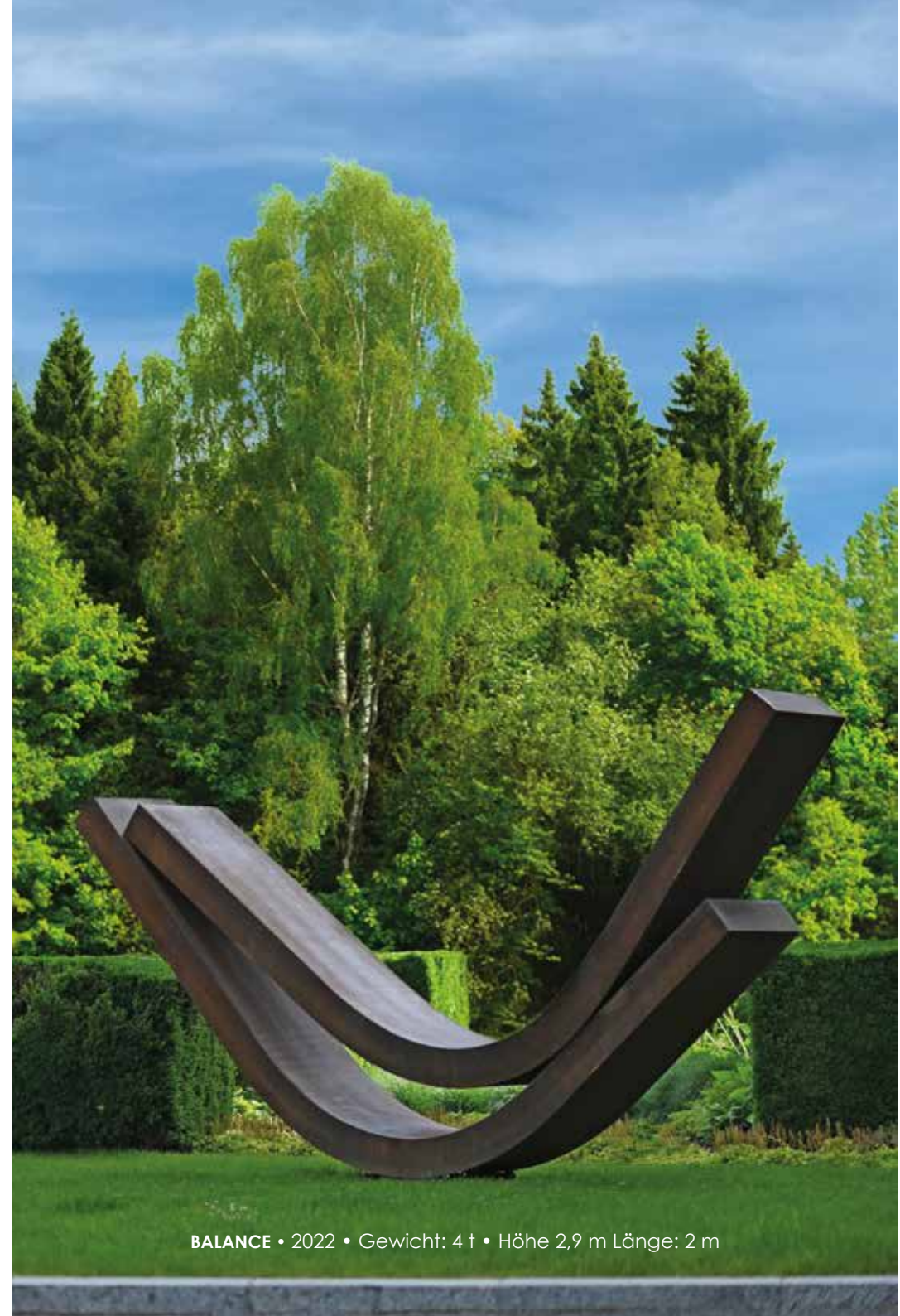
BALANCE • 2022 • Gewicht: 4 t • Höhe 2,9 m Länge: 2 m