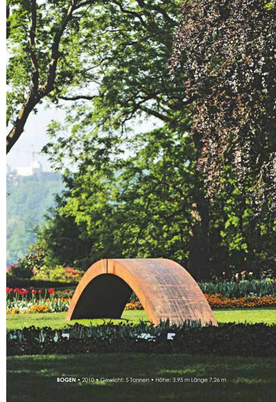
BOGEN • 2010 • Gewicht: 5 Tonnen • Höhe: 3,95 m Länge 7,26 m