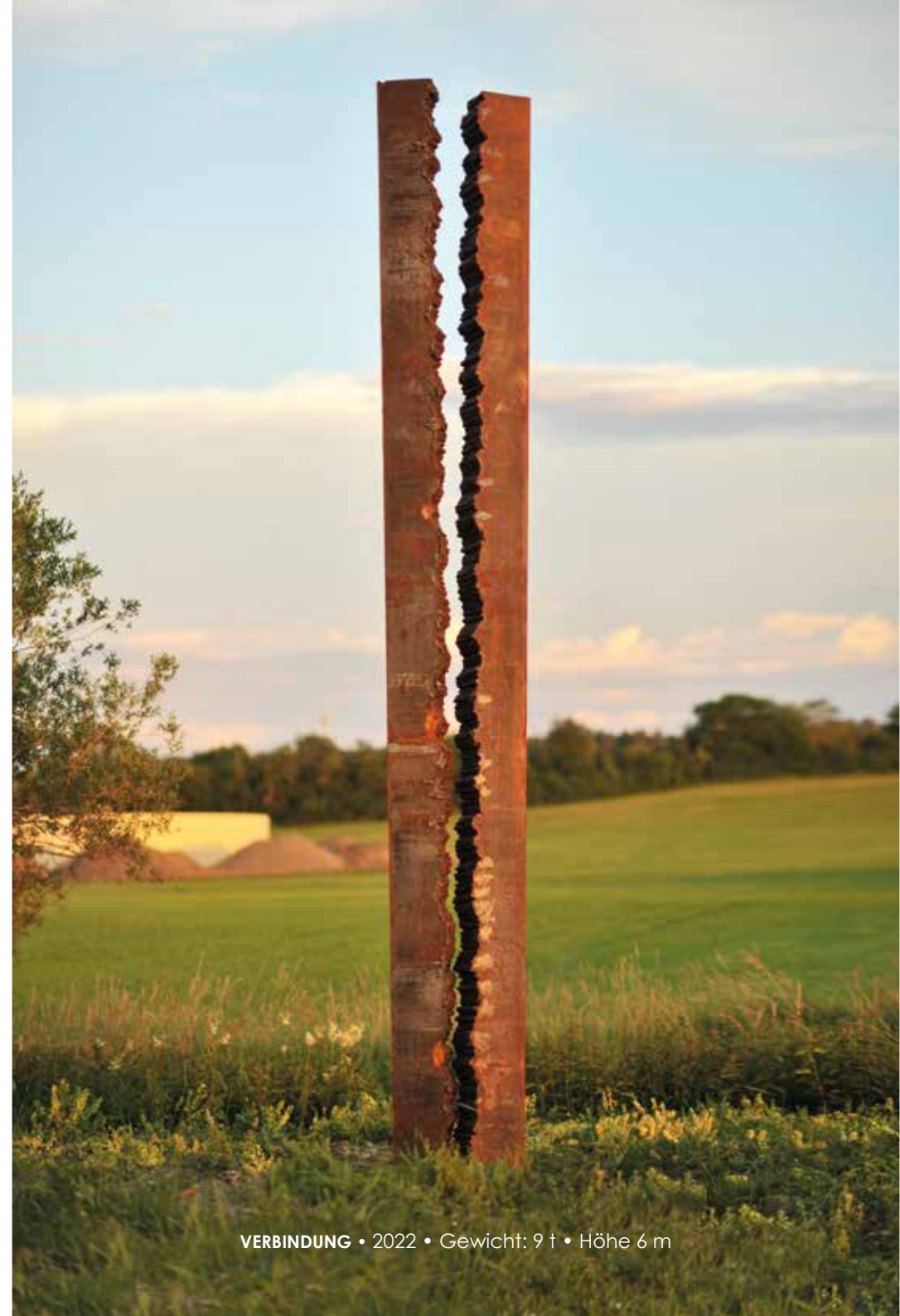
VERBINDUNG • 2022 • Gewicht: 9 t • Höhe 6 m