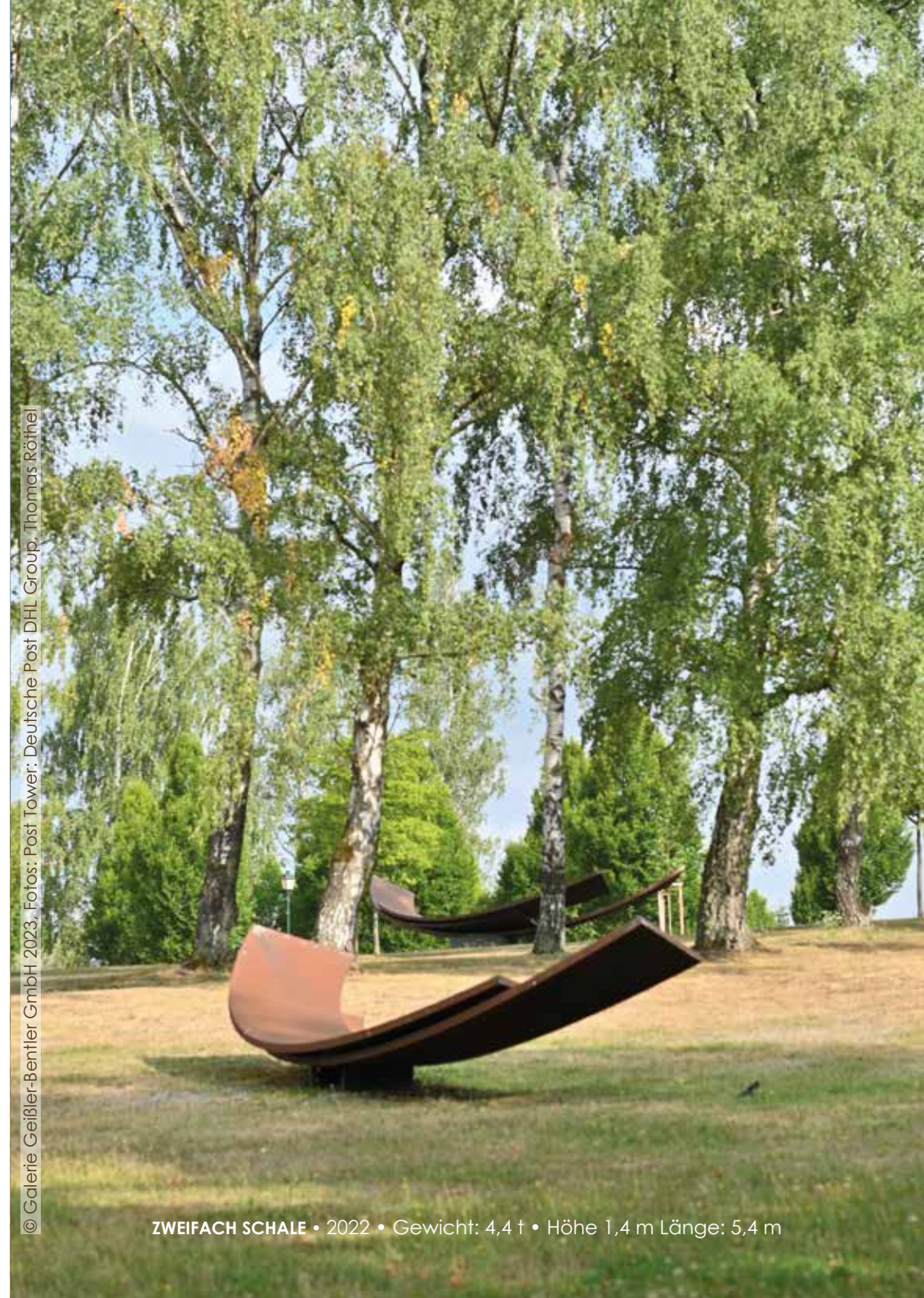
ZWEIFACH SCHALE • 2022 • Gewicht: 4,4 t • Höhe 1,4 m Länge: 5,4 m

© Galerie Geißler-Bentler GmbH 2023, Fotos: Post Tower: Deutsche Post DHL Group, Thomas Röthel